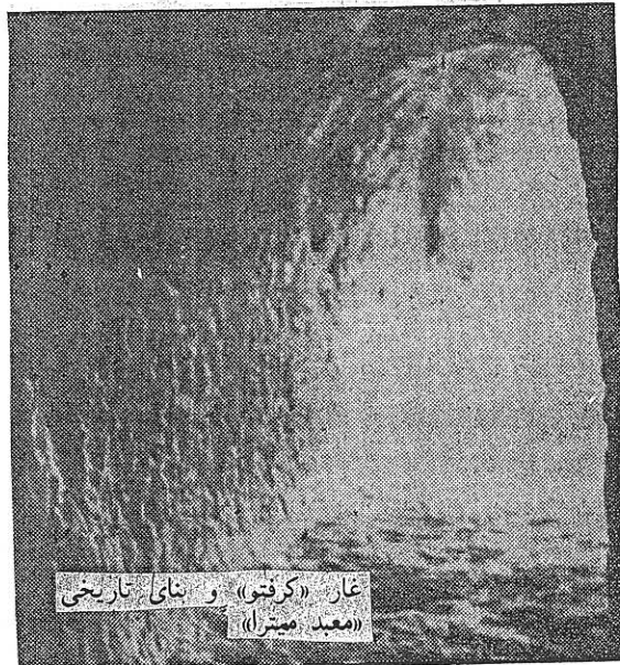
غار «کرفتو» و بنای تاریخی (معدن مینرا)