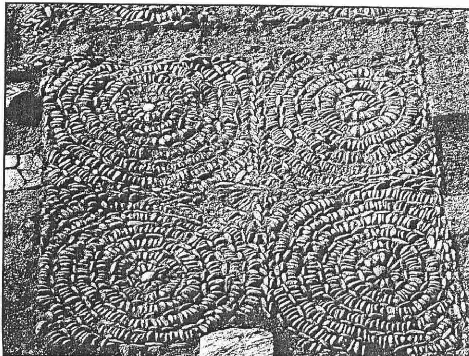
سردشت، کاوشهای محوطه باستانی ربط، نمایی نزدیک از سنگفرشها با دواير متحدالمركز.