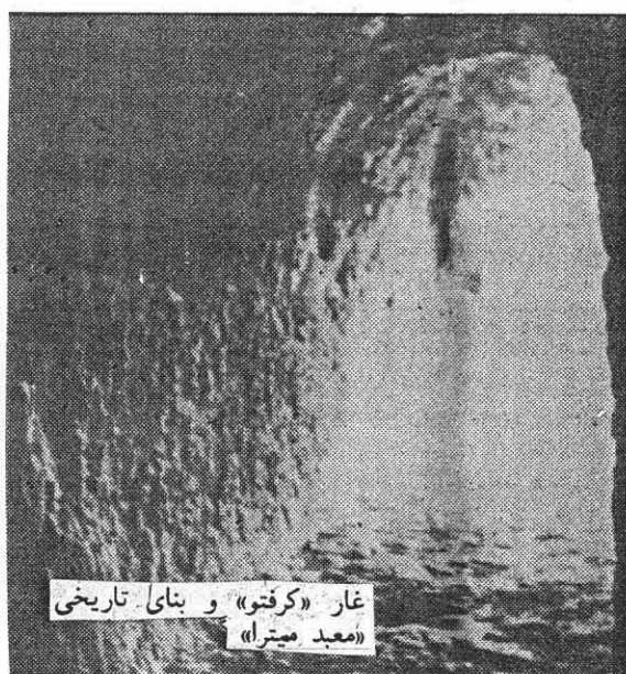
غار «کرفتو» و بنای تاریخی «معبد میترا»

ٲمہ مروٲی ھججی ٲہ، کہ بزہی سہرلیوی راستی و ئاشتی خوازی و دوستی لی ٲہ باری ٲم میزہرو و ٲہرہنجییہی ہری، تاییہ تی خوٲہ تی ٲم ٲیاوہلہ بہردہس تہنگی و نہداری بوٲا وہی شہش مانگک لہما لہو و خہریکی کللاش چنن ٲہبی - ۶ مانگیش بوٲروتنی دہسکرده کہی خوٲی، بہ ٲیا دہبہنا و کوردستانا ٲہ گہری، تاکلاشہدہس دورہ کانی خوٲی ٲہ فروشی.