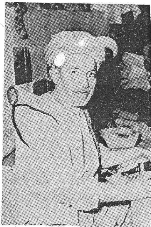
ئیره‌ گوندى هه‌جیجه، مه‌دینه‌ی فازيله‌ گچکه‌ به‌ک واله‌نا و چرو به‌رده‌لانی کوردستانا به‌.