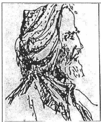
(حاجی قادری کوئی)

۲ - دیاره‌ زانا و شاعیری ناودار، مه‌لا خدری نالی - ش که‌ دوای مه‌لای جزیری، هاتووه‌ته‌مه‌یدانی شیعر دانانی کوردی که‌ به‌یه‌که‌م شاعیری گه‌وره‌ی کلاسیستی کوردی خولی خوئی ناو ده‌برئ، دژایه‌تیبه‌ک سازنادری که‌ قوتابخانه‌ی نالی - ش تا بیسته‌کان و سییه‌کانی سه‌ده‌ی بیسته‌م، هه‌ر درێژه‌ی هه‌بوو، چونکه‌ له‌ نیوان غه‌زه‌لی مه‌لای جزیری و نالی - دا، زیاتر له‌ دو سه‌د سال زیاتر ماوه‌ هه‌یه‌ که‌ دیاره‌ ئه‌م ماوه‌یه‌ش که‌ بو‌شایی خستووته‌نیوان غه‌زه‌لی کوردی، له‌به‌ر نه‌بوونی ده‌سه‌لاتداری کورد خوئی؛ روی داوه‌و ناموو بیگانه‌ش، به‌ری گه‌شه‌کردن و په‌ره‌سه‌ندنی زمان و فه‌ره‌ه‌نگ و شیعر و غه‌زه‌ل و هونه‌ری کوردی گرتوووه‌.