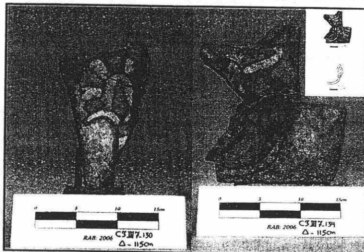
سردشت، کاوشهای محوطه باستانی ربط، تصاویری از نقوش گیاهی.