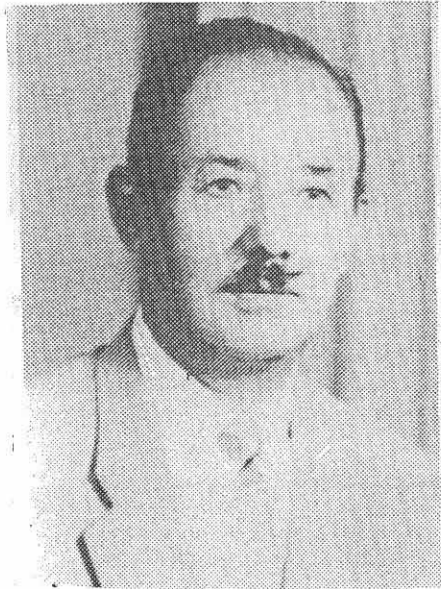
زه نرال ئىحسان نورى پاشا

له سانى ۱۹۲۸ ئىحسان نورى پاشا به فه رمانده يى چهن هزار مەردى جهنگى كاركوشته و مونزه بيت و موجهه ز تالاي كوردستانى هه لدا و ئيدارات و يانه ى دامه ز رانده و ئىبراهيم پاشا حسكى خه لكى تلو ناودار به (حسكى تلو -) بووه سه روئى ده وله تى كوردى به مجوره كومارى كوردى ئارات به دى هات.