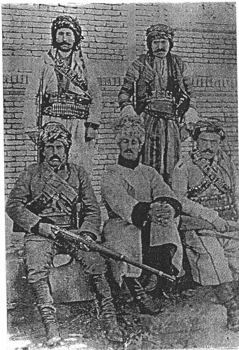
۱ Isma'il Aqa (Simko) seated, centre. This photograph was given to the author by Simko's son.